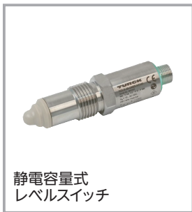
静電容量式 レベルスイッチ