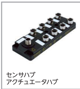
センサハブ アクチュエータハブ