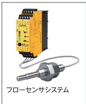
フローセンサシステム