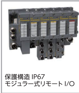
保護構造 IP67 モジュラー式リモート I/O