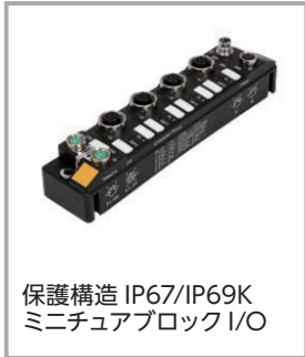
保護構造 IP67/IP69K ミニチュアブロック I/O