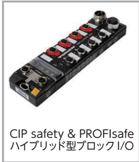
CIP safety & PROFI-safe ハイブリッド型ブロック I/O