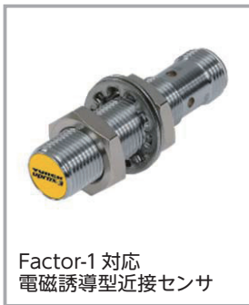
Factor-1 対応 電磁誘導型近接センサ