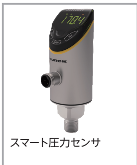
スマート圧力センサ