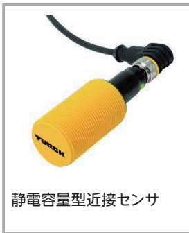
静電容量型近接センサ