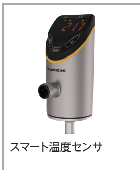
スマート温度センサ