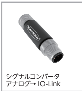
シグナルコンバータ アナログ→IO-Link