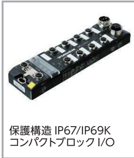
保護構造 IP67/IP69K コンパクトブロック I/O