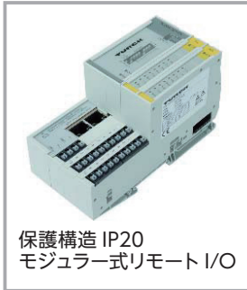
保護構造 IP20 モジュラー式リモート I/O