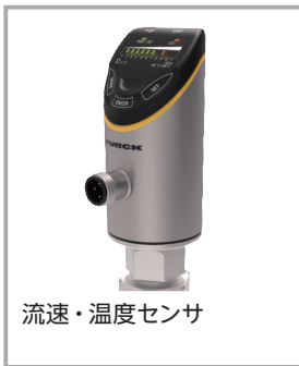
流速・温度センサ