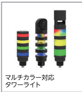
マルチカラー対応 タワーライト