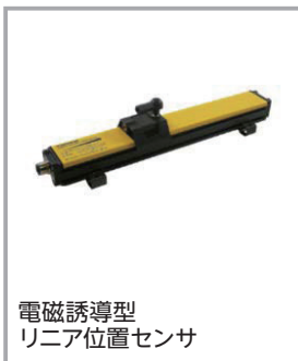
電磁誘導型 リニア位置センサ